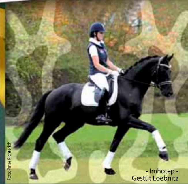
- Imhotep - Gestüt Loebnitz