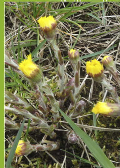
OBEN Eine kleine Huflattichkolonie findet sich auch in kräuterarmen Gegenden fernab von Straßen. Stellt man aus einigen Blüten mit Stengeln eine Tinktur her, schon das die Pflanzenbestände!